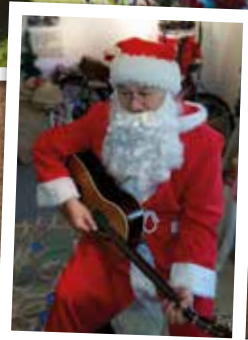
Joulupukki ja kitara!