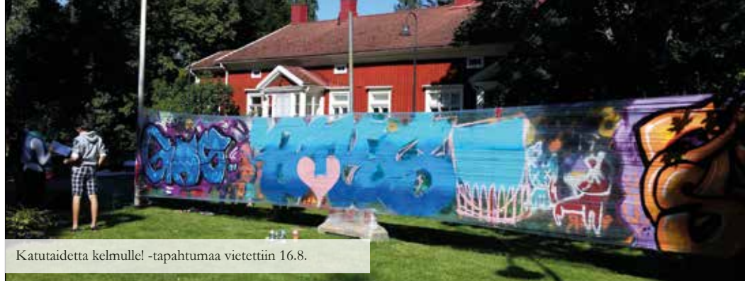
Katutaidetta kelmulle! -tapahtumaa vietettiin 16.8.